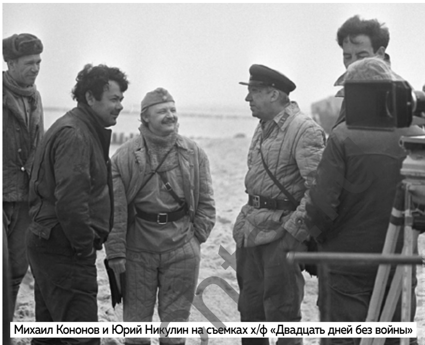
Михаил Кононов и Юрий Никулин на съемках х/ф «Двадцать дней без войны»

Никулин выступал на арене цирка более тридцати лет, совмещая работу со съемками в кино.