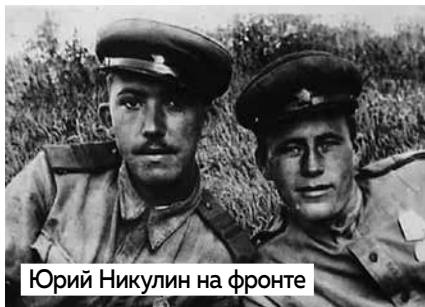
Юрий Никулин на фронте

Первое время Юрий выступал в качестве ассистента популярного клоуна Карандаша, а позже стал работать в паре с комедиантом и акробатом Михаилом Шуйдиным.