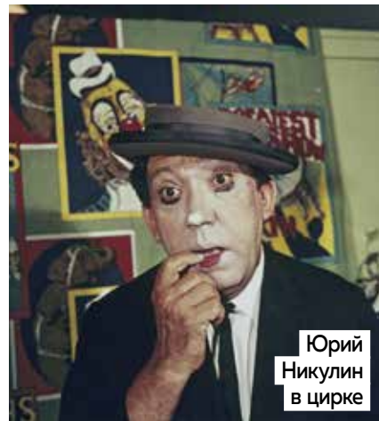
Юрий Никулин в цирке

Несмотря на большое количество запомнившихся зрителю комедийных ролей, в актёрском арсенале Юрия Владимировича есть и серьёзные драматические образы. Стоит вспомнить роль младшего лейтенанта Глазычева в картине «Ко мне, Мухтар!» (1964 год)